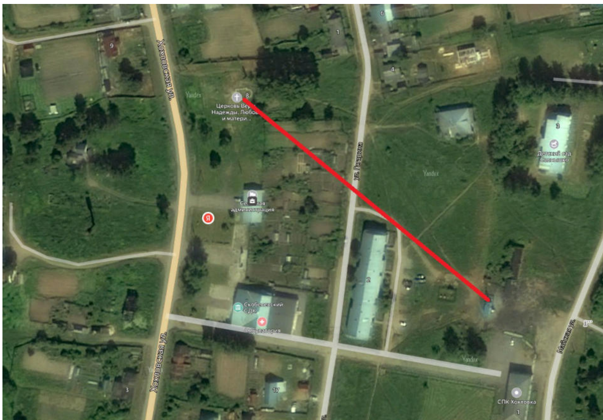
Рисунок 3. Радиус эффективного теплоснабжения котельной д. Скобелевка.

Схематически Радиусы эффективного теплоснабжения по котельным сельского поселения отображены на Рисунке 3.