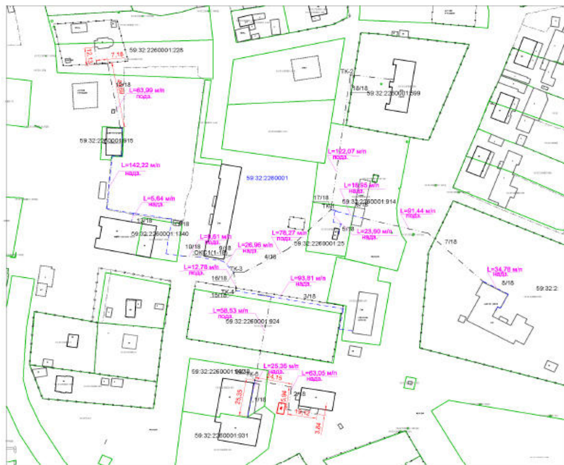
Схема расположения сооружения на кадастровом плане территории наименование объекта: теплотрасса кадастровый номер: 59:32:2260001:973 протяженность: 871 м адрес объекта: Пермский край, Пермский район, Хохловское с/п., д. Скобелевка масштаб 1:2000